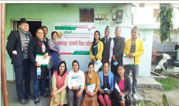
नयाँ शेयर सदस्यहरुलाई आधारभूत सहकारी शिक्षा तालिमको सामुहिक फोटो ।