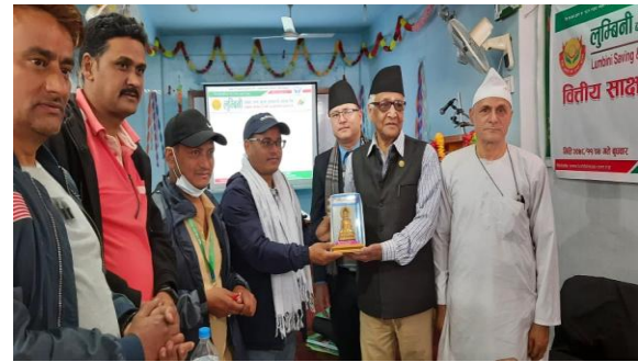
अध्ययन अवलोकन भ्रमण कार्यक्रममा मायाँको चिनो साटासाट ।