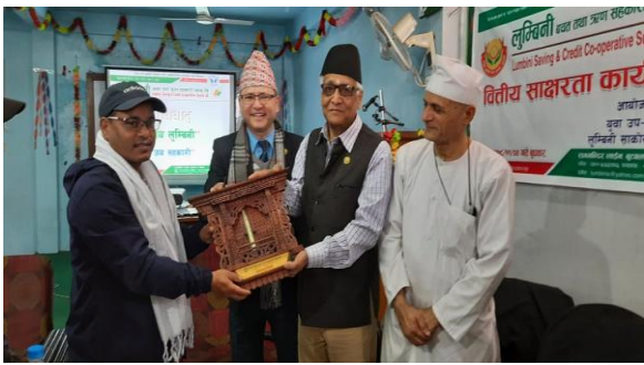
अध्ययन अवलोकन भ्रमण कार्यक्रममा मायाँको चिनो साटासाट ।