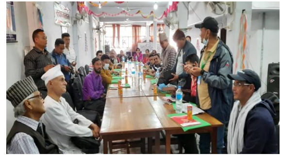
अध्ययन अवलोकन भ्रमण कार्यक्रममा नौलो साकोसका व्यवस्थापकहरुबाट संबोधन ।