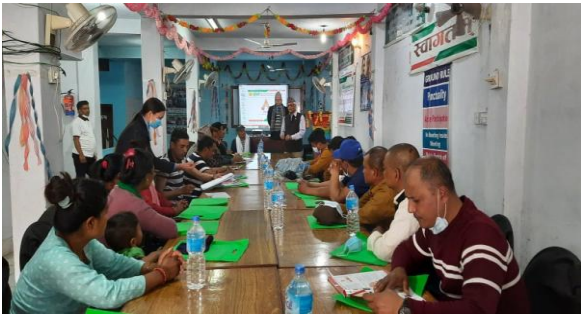
अध्ययन अवलोकन भ्रमण कार्यक्रमका सहभागीहरु ।